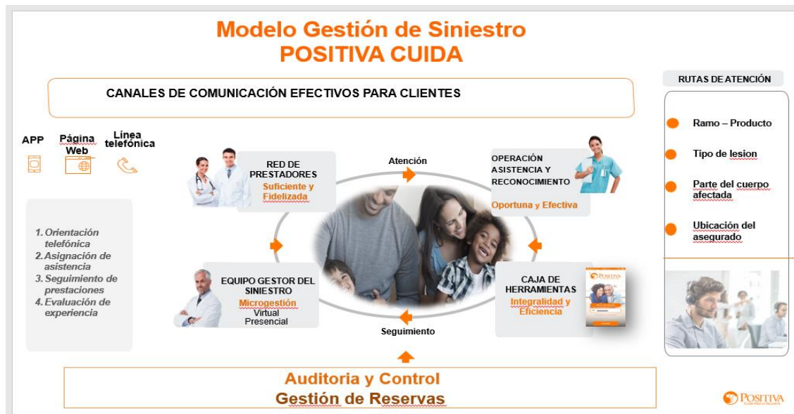
Figura 1. Modelo de Atención Positiva Cuida 2021

El Modelo POSITIVA CUIDA consta de cuatro (4) componentes: