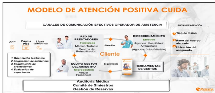
Figura 1. Modelo de Atención Positiva Cuida 2019

El modelo de atención integral del siniestro POSITIVA CUIDA, se define como el Programa que en forma ágil, confiable, dinámica y eficiente asiste a los afiliados y/o asegurados y empresas de manera especializada ante la ocurrencia de un siniestro, identifica de forma oportuna al siniestrado y garantizando la atención médica requerida, realiza diferentes procesos de auditoría médica que permiten el seguimiento integral de los casos y el cumplimiento de la promesa de valor realizada a nuestros afiliados y/o asegurados.