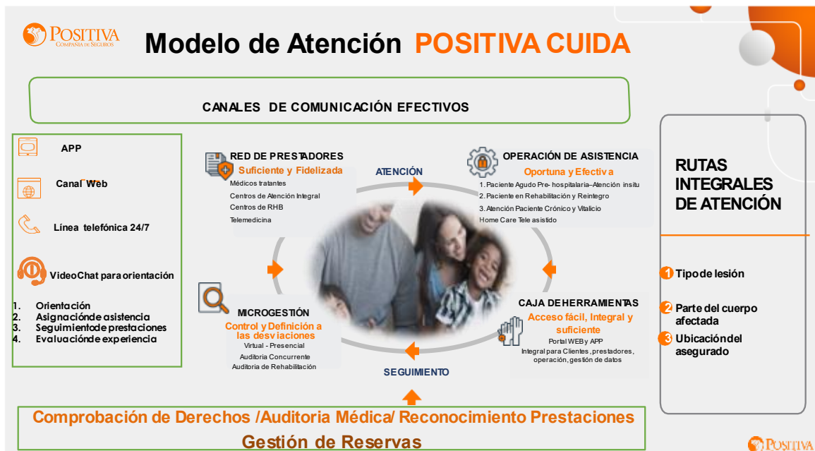
Figura 1. Modelo de Atención Positiva Cuida 2023

El modelo de atención es dinámico, se establece y formula de acuerdo con las necesidades del cliente, las coberturas o amparos concertados con el tomador del seguro.